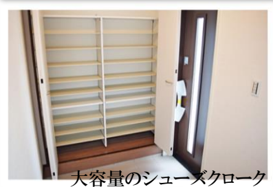
大容量のシューズクローク