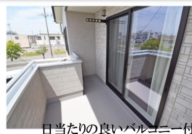
日当たりの良いバルコニー付